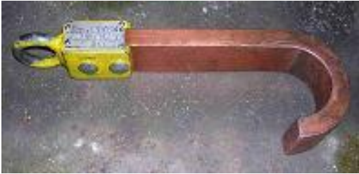
TIPO GANCIO RAME SOLLEVAMENTO ALBERI MOTORE PORTATA KG. 100