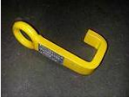
TIPO GANCIO ACCIAIO SOLLEVAMENTO SEMPLICE