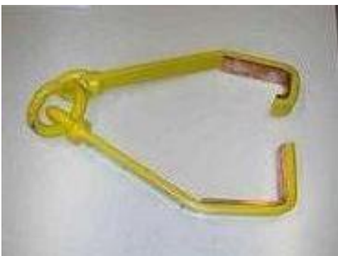
TIPO GANCIO ACCIAIO SOLLEVAMENTO BASAMENTO SUN