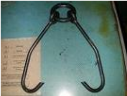
TIPO GANCIO ACCIAIO A FORCA SOLLEVAMENTO BASAMENTO SUN