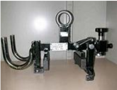
TIPO GANCIO MOVIMENTAZIONE BASAMENTO ALBERO MOTORE