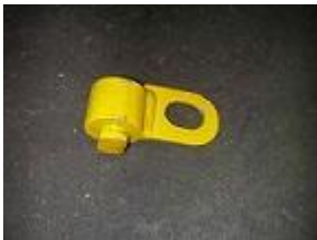
GANCIO A GOLFARE PER SOLLEVAMENTO BASAMENTO MOTORI PORTATA KG. 220

NB: GANCIO GIA' ESISTENTE NEL 1999 CON PORTATA KG. 219.