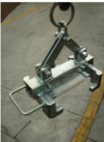
TIPO GANCIO SOLLEVAMENTO BASAMENTO PORTATA KG. 120