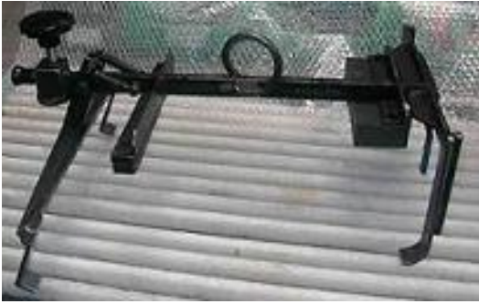
TIPO GANCIO ACCIAIO PRELIEVO CAMCARRIER