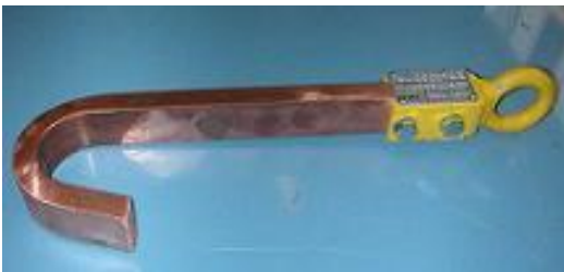
TIPO GANCIO RAME PER SOLLEVAMENTO BASAMENTO MOTORI PORTATA KG. 100

NB: GANCIO GIA' ESISTENTE NEL 1999 CON PORTATA KG. 219.